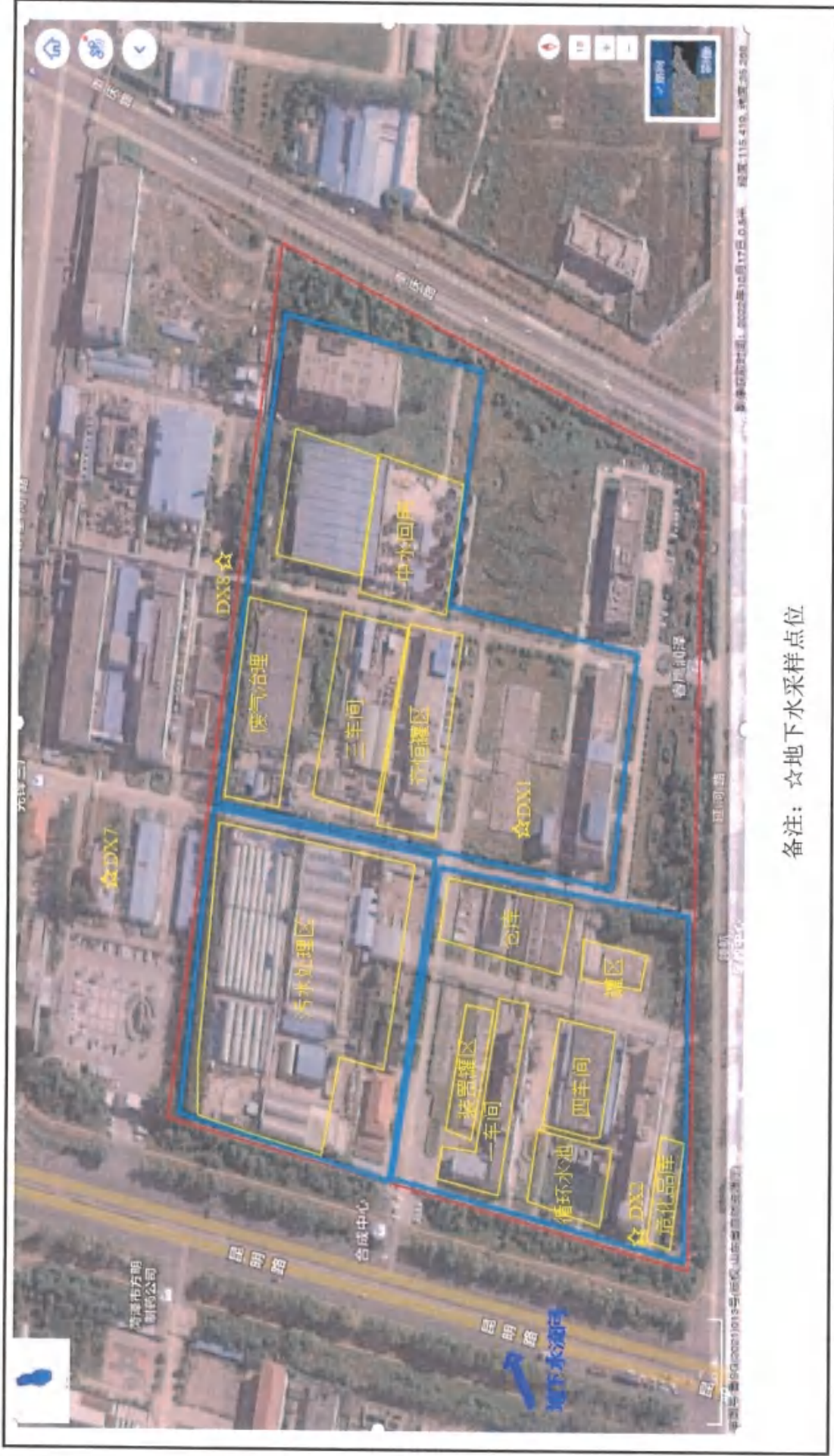
附图: 采样布点示意图